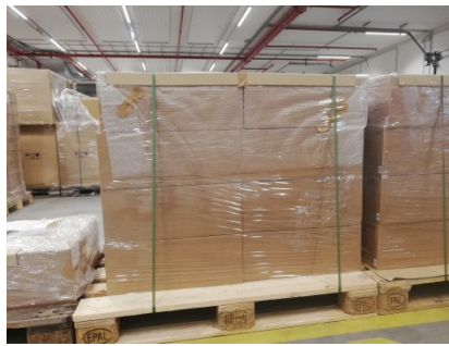
Abbildung 8: Kennzeichnung der Palette mit Klebeband