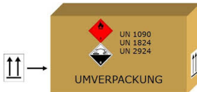
Abbildung 2: Beispiel für Kennzeichnung Gefahrgut Umverpackung

Sollten diese Punkte nicht eingehalten werden, so behält sich Wiener Netze das Recht vor, die Ware abzulehnen.