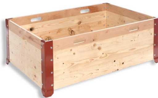
Abbildung 4: Europaletten-Aufsatzrahmen

Die Aufsatzrahmen haben dem Grundmaß von 800 x 1200 x 400 mm (ÖNORM A 5301: 1973 12 01) zu entsprechen.