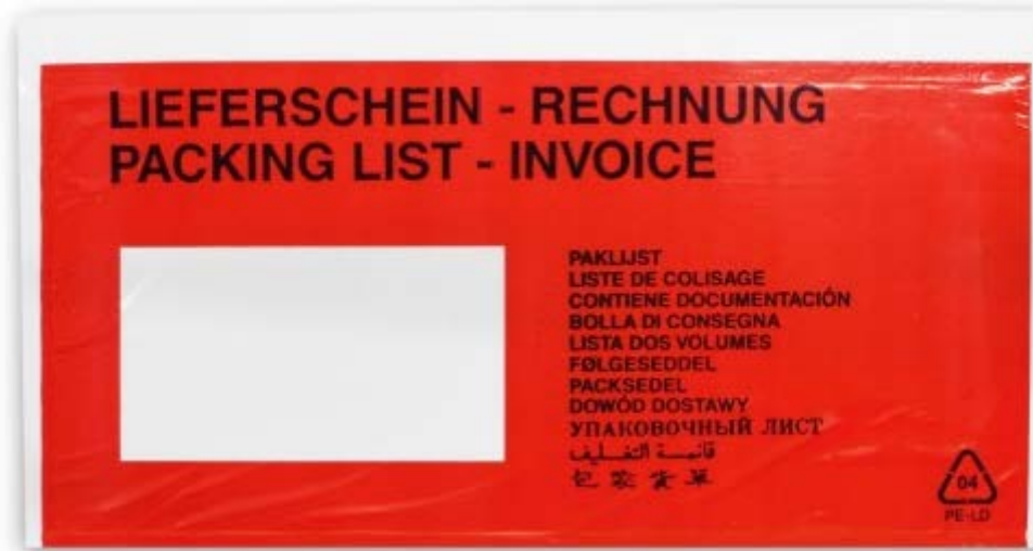
Abbildung 1: selbstklebende Lieferscheintasche