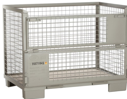
Abbildung 6: Euro Gitterboxen

Die Gitterboxen haben dem Grundmaß von 835 x 1240 x 970 mm (DIN 15155/8 und ÖNORM A5321) zu entsprechen und mit EUR gekennzeichnet sein.