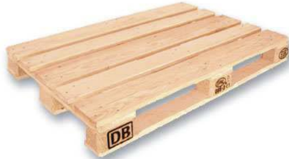
Abbildung 3: Euro Palette

Die Paletten haben dem Grundmaß von 800 x 1200 x 144 mm (ÖNORM A 5300) zu entsprechen und müssen am Eckklotz mit EUR oder EPAL gekennzeichnet sein.